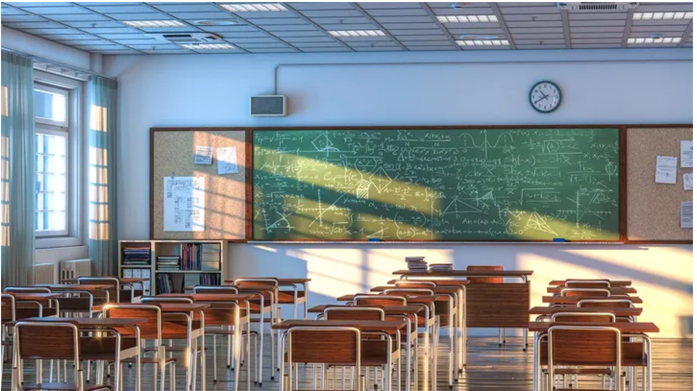
The interior of a school classroom with wooden desks and chairs.

Après d'intenses contrecoups publics, un porte-parole du ministère de l'Éducation dans la capitale de l'État de Basse-Saxe a déclaré: "Le concept éducatif sous cette forme met en danger le bien-être de l'enfant."